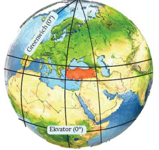
Ülkemizin Dünya'daki yeri