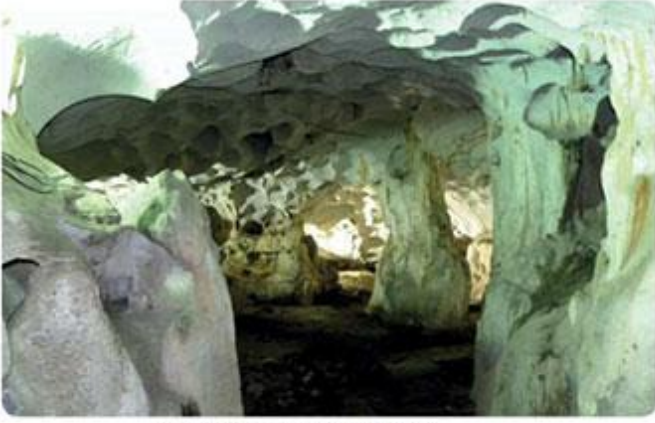
Karain Mağarası (Antalya)