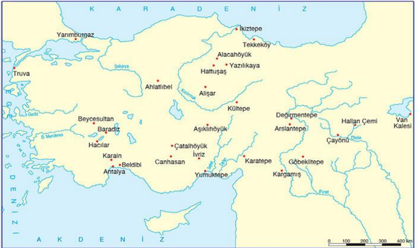
Anadolu'daki ilk yerleşme alanları

Günümüzden yaklaşık 10.000 yıl önce Anadolu'da, Buzul Çağ'ının etkilerinin sona ermesiyle kapalı havzalarda bulunan göller, sıcaklığın artmasına bağlı olarak yavaş yavaş alan kaybetmiş ve çevrelerinde tarıma uygun geniş bölgeler ortaya çıkmıştır. Tarıma uygun bu alanlarda mağara yaşamı ve avcılık toplayıcılık ekonomisi yerini, yerleşik düzende yapılan tarım ve hayvancılığa bırakmıştır. Böylece Anadolu topraklarında ilk köy tipi yerleşmeler ortaya çıkmıştır (10.000-7.000 yıl önce). Ayrıca bu dönemde köpek başta olmak üzere evcilleştirilen hayvanların gücünden ve ürünlerinden yararlanılmaya başlanmıştır.