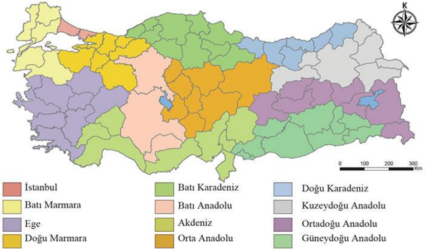
Düzyey 1 olarak belirlenmiş Türkiye'nin büyük istatistik bölgeleri

22 Eylül 2002 tarihli 2002/4720 sayılı Bakanlar Kurulu kararı ile "Avrupa Birliği Bölgesel İstatistik Sistemi" adıyla yürürlüğe konan istatistik bölge birimleri sınıflandırmasında illerin her biri "Düzyey 3" olarak adlandırılmıştır. Coğrafi, ekonomik, sosyal ve kültürel açıdan birbirine benzeyen komşu iller ise ekonomik etki alanları ve nüfus miktarları baz alınarak "Düzyey 2" ve "Düzyey 1" olarak sınıflandırılmıştır.