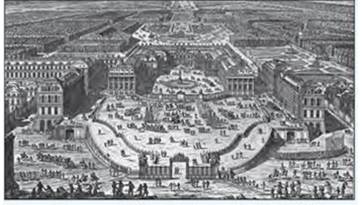
Versay Sarayı ve Paris şehrinin temsili çizimi (1682)

önemini ve etkisini daha da artırdı. 1661 yılında yapımına başlanan Versay Sarayı, Paris şehrinin gelişimini etkiledi. Bu dönemde şehrin önemli merkezleri saray etrafına toplanmıştı. Paris'in etki alanı genişledikçe nüfusu da artmaya başladı. 1800'lü yılların başında 700 bin civarında olan şehir nüfusu, 1850 yılında 1,5 milyona yaklaştı. Tüm diğer Avrupa şehirleri gibi Paris'te de asıl fonksiyonel ve demografik gelişim Sanayi Devrimi sonrasında gerçekleşti. Kurulan büyük fabrikalar ve artan iş olanakları sayesinde sürekli göç alan Paris'in nüfusu 1870'te 2,5 milyonu, 1890'da 3,2 milyonu buldu.