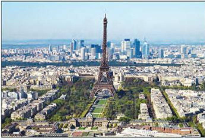
Günümüzde Paris şehrinde bir görünüm

Günümüzde Paris tarihî eserleri, sanatsal ve kültürel yaşamı, ekonomik ve politik etkisi, dünya çapında etkili finans merkezleri ve tüm dünyayı birbirine bağlayan büyük hava alanları sayesinde küresel bir cazibe merkezidir. Modanın da başkenti olarak anılan Paris, her yıl yapılan fuarlar, defileler ve etkinliklerle adını tüm dünyaya duyurmaktadır. Tarihî eserlerin geceleri özel ışıklandırılması sayesinde adeta bir masal şehrine dönüşen Paris'e " Ville Lumiere " yani ışık şehri denilmesi hiç de şaşırtıcı değildir.