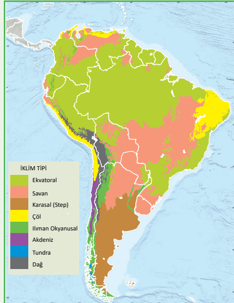
Harita 2: Güney Amerika İklim Haritası