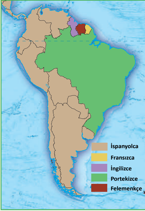
Harita 5: Güney Amerika Dil Haritası