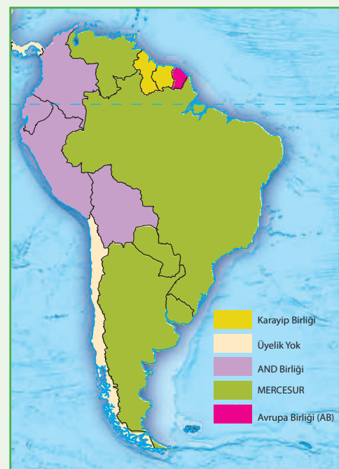
Harita 4: Güney Amerika Bölgesel Örgüt Haritası