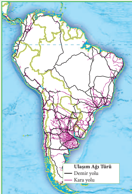
Harita 3: Güney Amerika Ulaşım Haritası