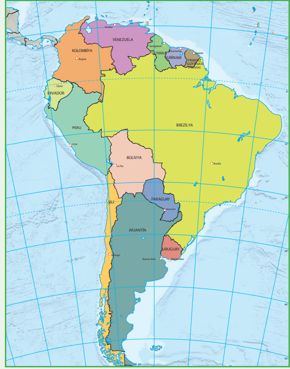
Harita 6: Güney Amerika Siyasi Haritası